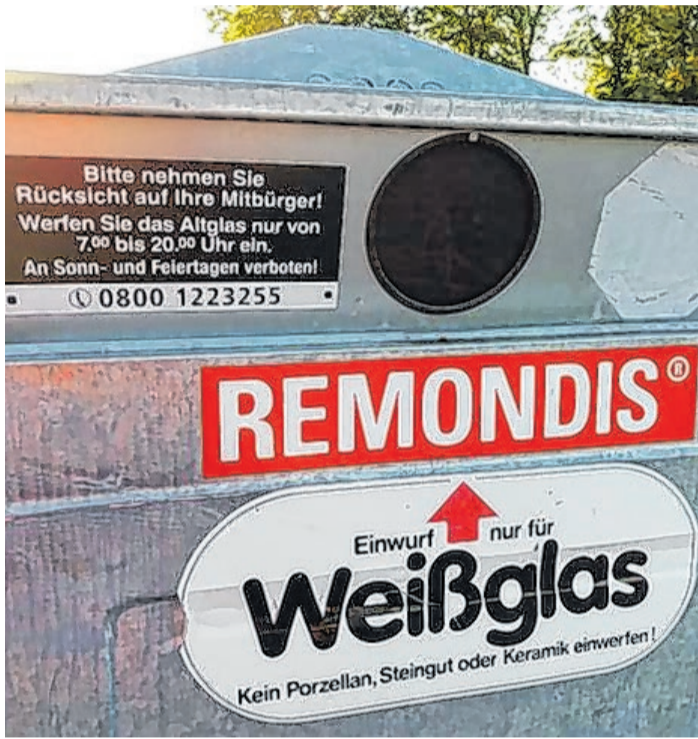
Beim Glaseinwurf an die Nachbarn denken

In Wohngebieten ist das Einwerfen von Altglas nur werktags von 7 bis 20 Uhr erlaubt. Darüber hinaus sollte aus Rücksicht auf die Nachbarn auch die Mittagsruhe zwischen 12 und 15 Uhr beachtet werden. Außerhalb von Wohngebieten ist der Glaseinwurf nachts zwischen 22 und 6 Uhr sowie an Sonn- und Feiertagen verboten. Wer sein Altglas während der gesetzlichen Ruhezeiten in einen Container wirft, kann in drastischen Fällen mit einem Bußgeld von bis zu 500 Euro bestraft werden.