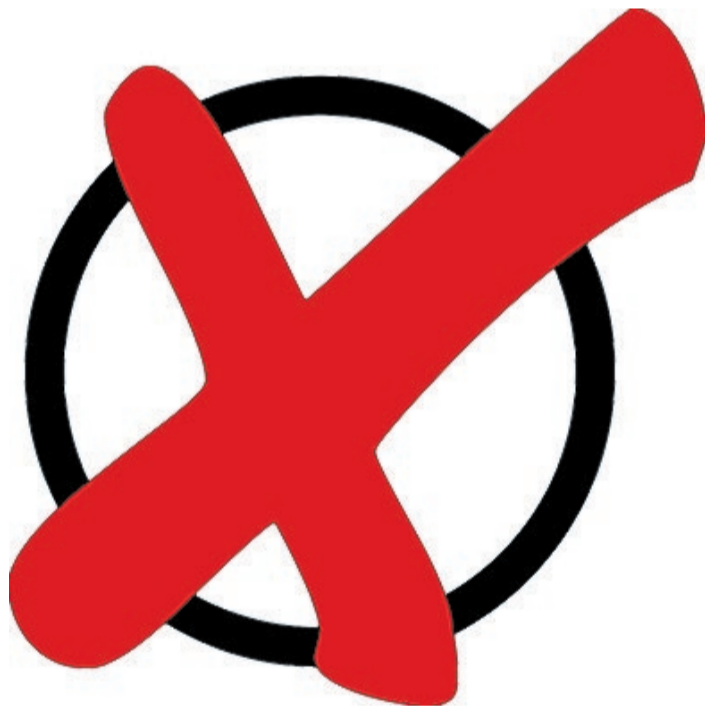
Ab 13. August können Bornheimer Bürger ihre Stimme abgeben

Bornheimer Bürger, die bis zum 23. August 2020 keine Wahlbe-