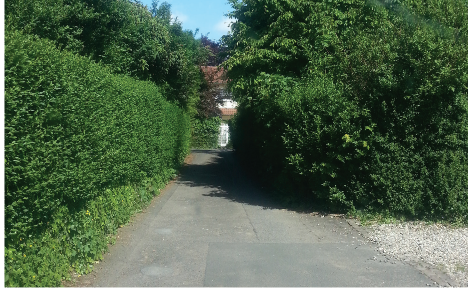
■ Überwuchs kann zu Ärger führen.

In der Zeit vom 1. März bis zum 30. September ist es aus Naturschutzgründen zwar verboten, Hecken, Wallhecken, Gebüsche sowie Röhricht- und Schilfbestände zu roden, abzuschneiden oder zu zerstören. Schonende Form- und Pflegeschnitte sowie Maßnahmen zur Beseitigung verkehrsgefährdender Situationen