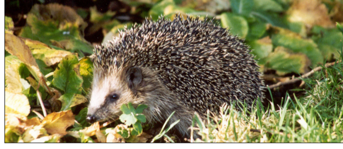
■ Igel auf Nahrungssuche.

Wer einen hilfsbedürftigen Igel im Haus pflegen möchte, bekommt in einem kostenlosen Infoblatt der Stadt Bornheim erste Tipps zur richtigen Betreuung sowie Hinweise auf ausführliche Literatur. Das Infoblatt gibt es bei Irmgard Mohr im Umwelt- und Grünflächenamt unter 02222/945-310 oder auf der städtischen Homepage unter www.bornheim.de/fileadmin/pdf/rathaus/Umweltbeauftragter/Igel14.pdf . Weitere Infos findet man auch unter www.pro-igel.de .