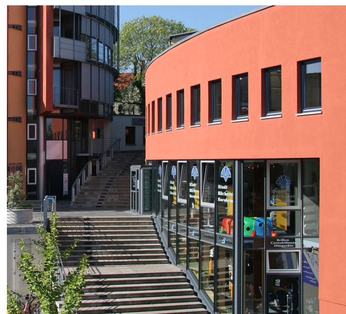
■ Die Stadtbücherei Bornheim im Servatius-Center.

Die Teilnahme ist kostenlos, eine Anmeldung ist nicht erforderlich.